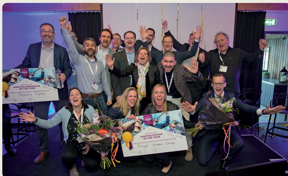
Alle winnaars van de portfoliomanagementawards

Portfoliomanagement helpt organisaties om een aantal veranderingsinitiatieven zodanig te coördineren dat ze optimaal bijdragen aan het behalen van de strategische doelen van de organisatie. Een portfolio wordt dan gedefinieerd als een set investeringen, die in de vorm van activiteiten, projecten en/of programma's in samenhang invulling geven aan één of meerdere van de strategische doelstellingen binnen een organisatie. In de praktijk bevordert portfoliomanagement niet alleen de samenwerking binnen het directieteam maar leidt het tot een betere samenwerking tussen onderlinge teams en een gedeelde visie. ●